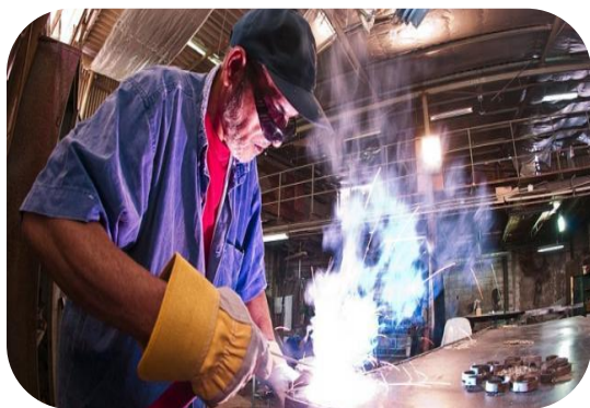
Duurzaam aan het werk