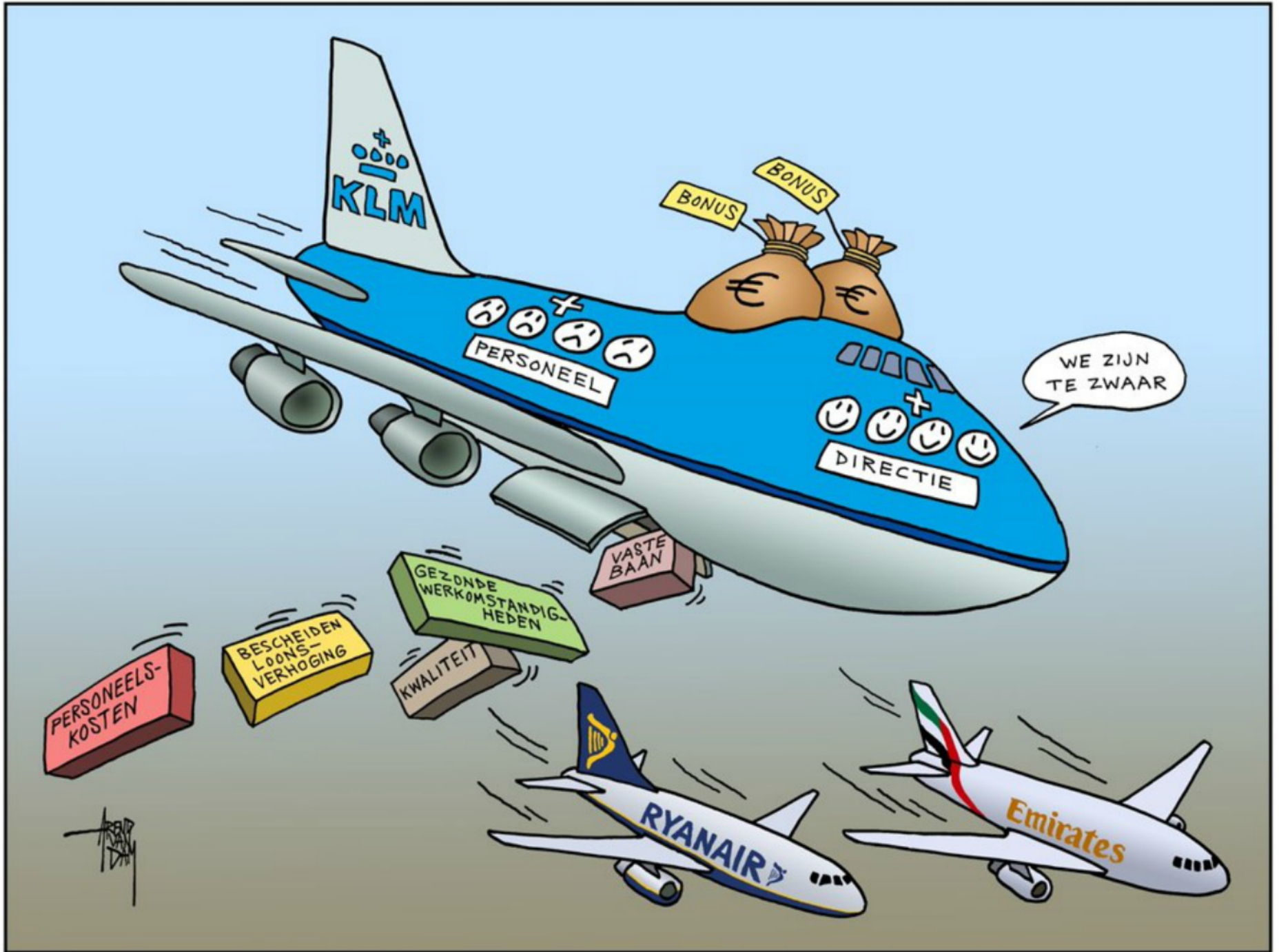
"race to the bottom"